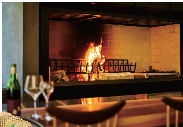
店内にしつらえられた存在感ある薪火窯。ゆらめく炎の魔法が、食材のうま味を封じ込め、独特の香りも添えて一層おいしく。エンターテインメントな雰囲気も楽しんで。

能仁寺の敷地内約1万㎡に4つの棟と多目的広場を備えるOH!!!で、驚きの発酵体験はいかが？ 食物のうま味や保存性、栄養価を高めてくれる発酵マジックに、思わず「OH!!!」。