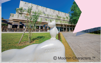
© Moomin Characters.™