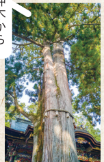
樹齢約800年の御神木から みなぎるパワーを感じる境内

家族みんなで楽しめる、三密にならない埼玉のきれいな空気を思いっきり吸い込んでのびのび