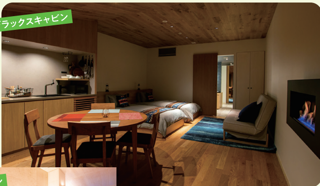
デラックスキャビン